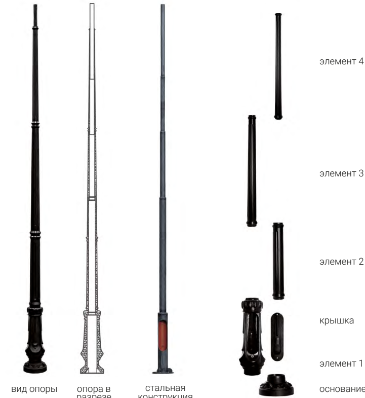
Пример конструкции опоры типа SM-1W/E